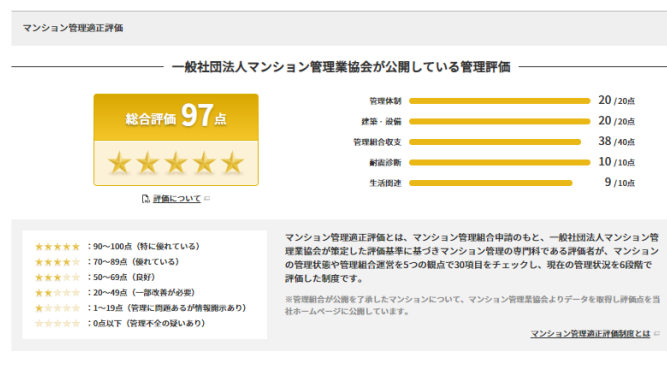
「マンション管理適正評価」表示内容

「ダイワハウスの中古マンションギャラリー」は、大和ハウス工業株式会社が過去に販売した分譲マンションを、大和ハウスリアルエステートが仲介するためのホームページです。大和ハウス工業株式会社がこれまでに全国で開発した分譲マンションのうち、918 物件の情報が掲載されており、販売中の中古物件があれば、物件価格や間取り、専有面積などの情報を確認できます。